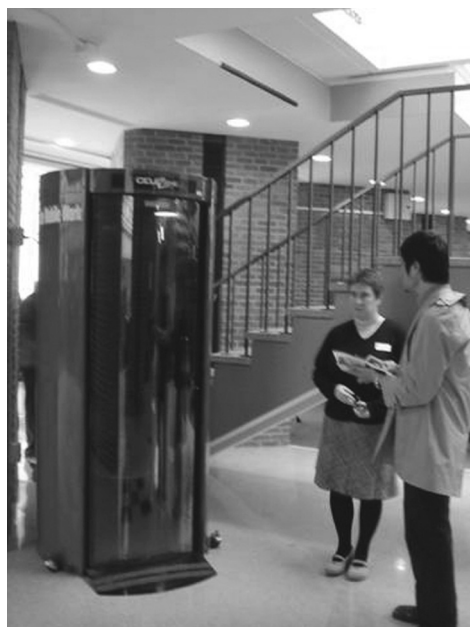
図12 携帯電話ブース

図11は、文具の自動販売機である。また、図12は携帯電話で会話をするためのボックスである。携帯電話での通話は情報サロンのような他のスペースでも許されているが、希望する利用者のために図のような携帯電話ボックスも用意されている。