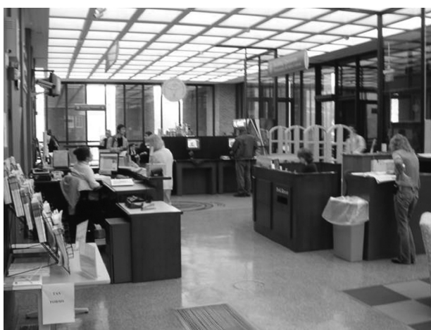
図3 入り口を内部から見たところ