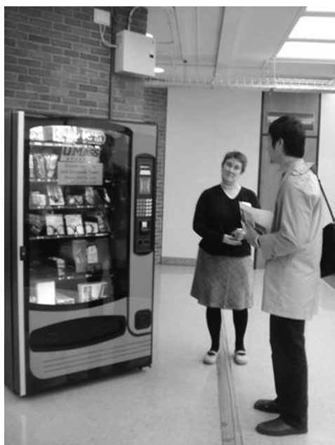
図11 文具の自動販売機

図13は、執筆指導センターのカウンタである。論文の執筆指導や、留学生の英文筆記の指導などをおこなう。