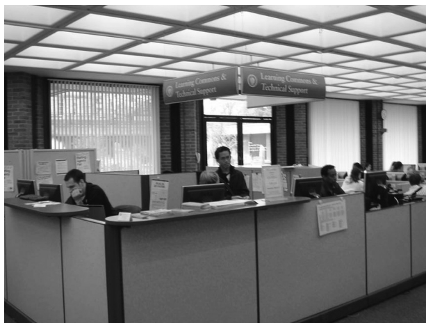
図10 テクニカルサポートのカウンタ