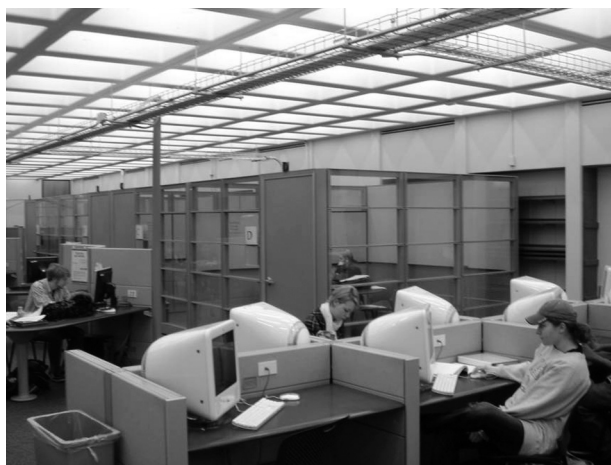
図8 情報サロンの風景3

図9は、図書館が管理するPCが使用中かどうかを一覧できる、訪問の一週間前に導入されたばかりのシステムである。技術的には、有線LANポートへの接続有無により使用中かどうかを判別している。情報サロンの入り口付近の目立つ場所においてあり、利用者も多い様子だった。