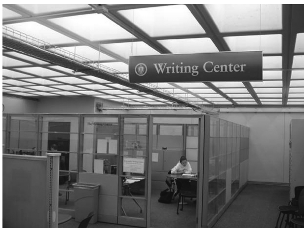
図13 執筆指導センターのカウンタ