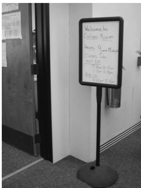
図15 クラスルームの風景

Learning Commons内には、講義室もある。教員が希望すれば、教員の講義のうち数時間を、図書館職員が受け持ち、情報検索をはじめとする講習をする。