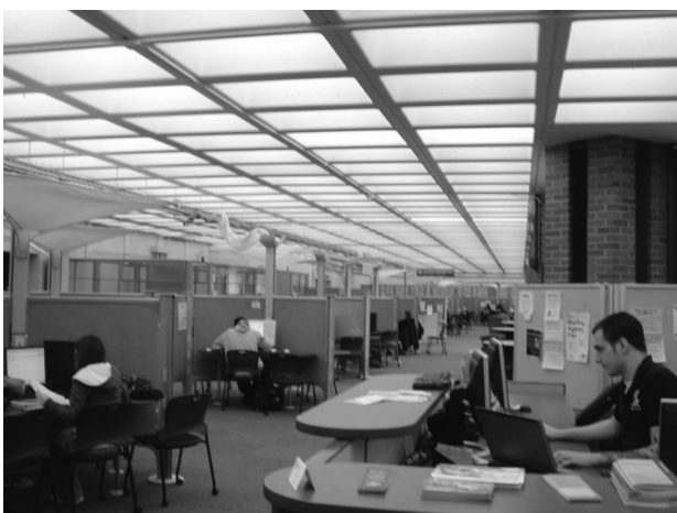
図7 情報サロンの風景2