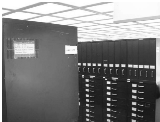
図4 昔ながらのマイクロフィルム庫

この図書館は、5年ほど前にLearning Commonsをいち早く導入して、様変わりしたそうである。Learning Commonsとは、「そこだけで学生生活のほとんどを完結することができる場所」と言えよう。Learning Commonsの導入により、実質利用者が急増し、そのせいで大学内での予算措置に成功し財政状況が一気に良くなったそうである。Learning Commonsのために、図4のような昔ながらのマイクロフィルム庫や本棚の一部を、閉架に一掃してスペースを確保したという。