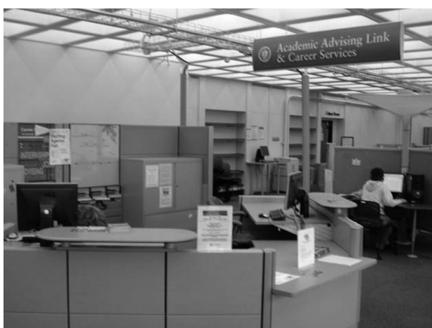
図14 就職指導センターのカウンタ