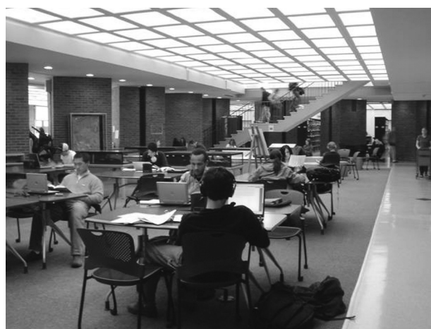
図5 多目的スペース

1階から階段を下りてLearning Commonsに入ると、まず見えるのが多目的スペースである。ここは普段は図5のように机が並べられているが、展示や集会などのイベントがあるときには取り払ってスペースを作る。このすぐ横には後述のPCの端末があるが、このようなイベントがあってもPCの端末などの他のスペースは利用できる。