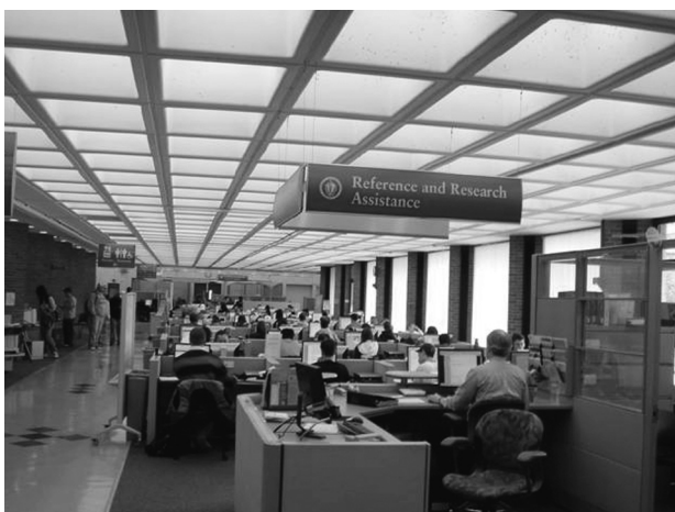
図6 情報サロンの風景1

PCは、図6～図8に示すように、パーティションで仕切られた机やそうでない机など、様々な形態のブースや机に置かれている。