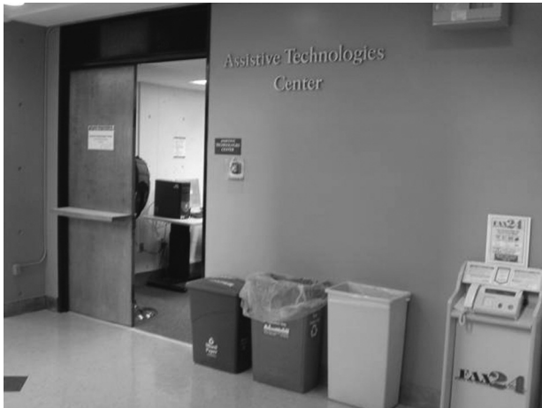
図16 補助装置センター

図16は、Assistive Technologies Centerと呼ばれる、身体が不自由な人のための特別な入出力装置が置いてある。ここはセンターとあるがそのような組織があるわけではなく、図書館と情報処理センターが共同して運営している。